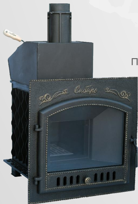
Банные печи премиум-класса «Сибирь»

НОВОСИБИРСКАЯ МЕТАЛЛООБРАБАТЫВАЮЩАЯ КОМПАНИЯ